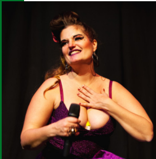
DIVA IN LOVE

La Compagnie So Castafiore ! est née début 2017. Elle est spécialisée dans le théâtre musical et regroupe des créations mêlant chant, musique, contes et théâtre de rue. L'envie d'un théâtre proche du public, mêlant plusieurs disciplines, réunit dans cette compagnie plusieurs artistes de divers milieux. La création est au coeur de notre travail ainsi que la transmission du théâtre, du conte et des arts burlesques et clownesques.