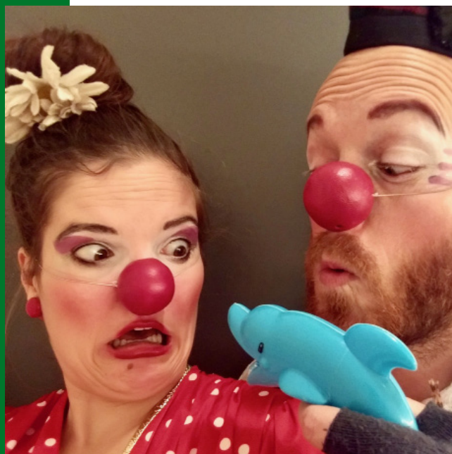
LÂCHONS LES CLOWNS !