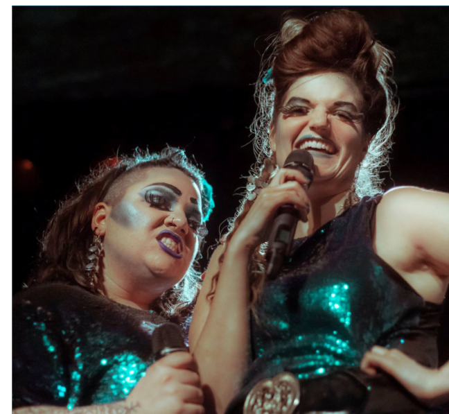
LES FUNKY SARDINES (passé)