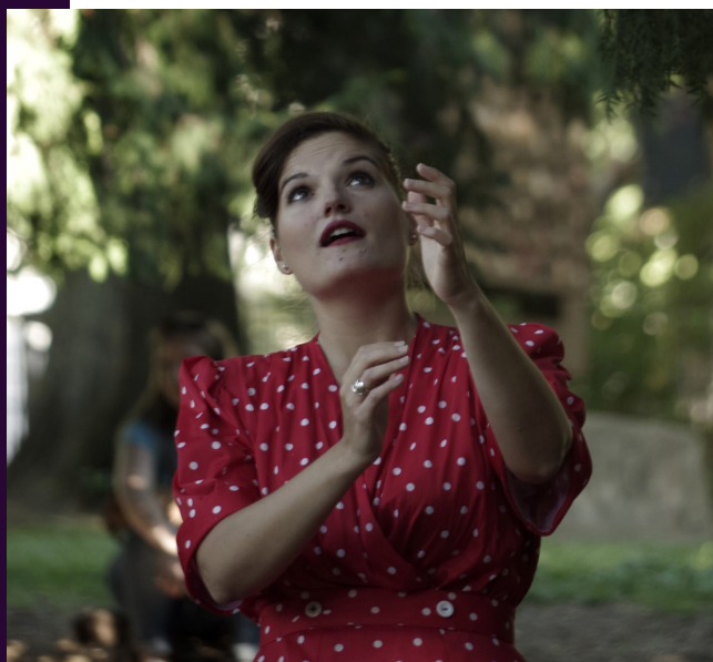
Les Contes de l'Affabuleuse