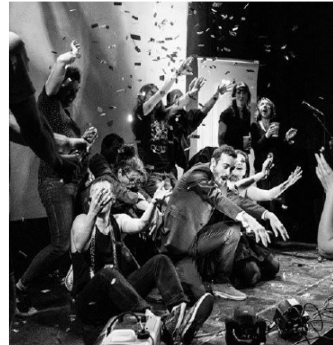
KARAOKE NIGHT FEVER